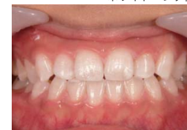
ホワイトニング後