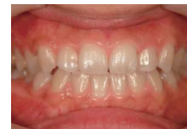
ホワイトニング前

※さらに白さを追求されたい方にはホームホワイトニングの併用をお勧めします。詳しくはお気軽にお問い合わせください。