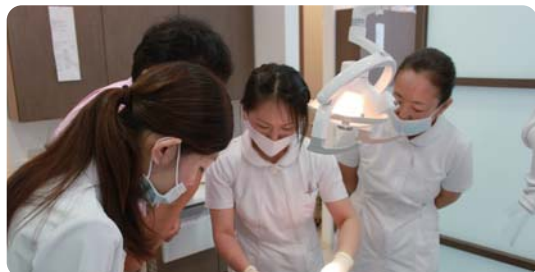
定期的に院内で勉強会を行い技術の向上に努めています

どの患者さんも緊張されていると思うので、当たり前ですがコミュニケーションを大事にしています。少しの言葉かけでも、緊張をほぐしていただければと思います、行なっています。