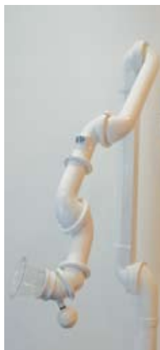
口腔外バキューム

当院では皆様様のプライバシーをお守りし、リラックスして診療を受けてもらうため、診療は個室か半個室の診療室で行います。天井が高く光あふれる診療室内で、皆様のお口の状態を画像を使い丁寧に説明差し上げてから治療を始めます。また、診療室内の空気にも気を配り、診療機材から出される粉塵を強制的に吸引する機械を各診療台に設置していますので、呼吸器系の弱い方でも安心して治療を受けることができます。