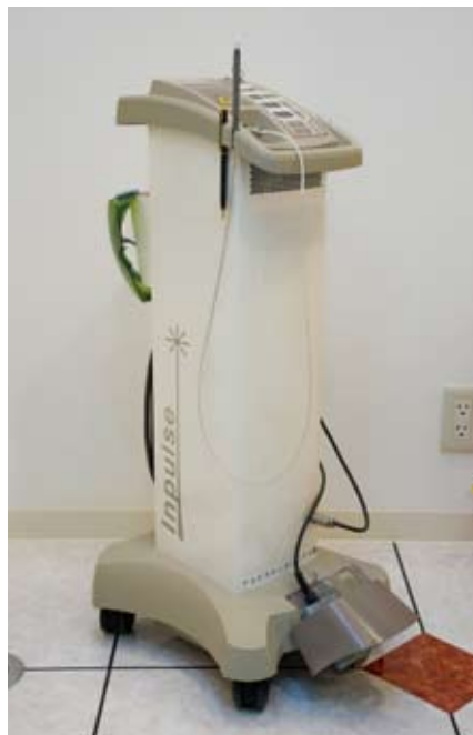
さまざまな治療に応用できるレーザーメス

当院では最新のレーザーでさまざまな治療をより確実なものにしていますが、医療機器だけに頼ることなく、歯科医師の技術と人間性も研鑽しています。