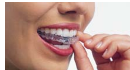
マウスピースによる透明で目立たない矯正装置インビザライン