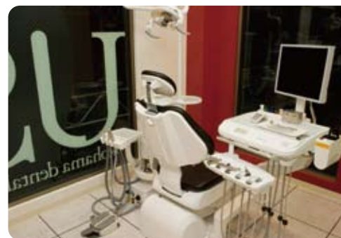
全室プライバシーを守る個室化された診療室にしました