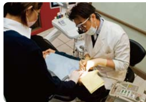
歯科専用ルーペを使用した、精密で確実な治療を行います