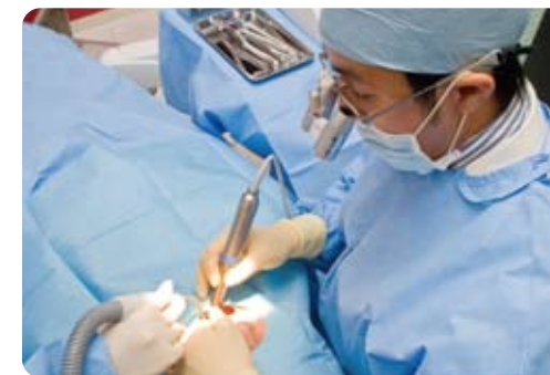
インプラントは衛生面への配慮が行われている専用オペルームで、安全・確実にいきます