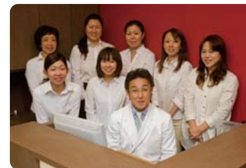
歯のことでお悩みでしたらお気軽にご相談ください

HP も開設いたしました。 院長の開業に至るまでの道のりや 診療についてのブログも公開予定